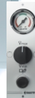
Bedieneinheit Laborabzug RXE212

einer speziellen Sensorschaltung wird gleichzeitig eine gefährliche Strömungsrichtungs-umkehr bei einem Unfall sicher erfasst.