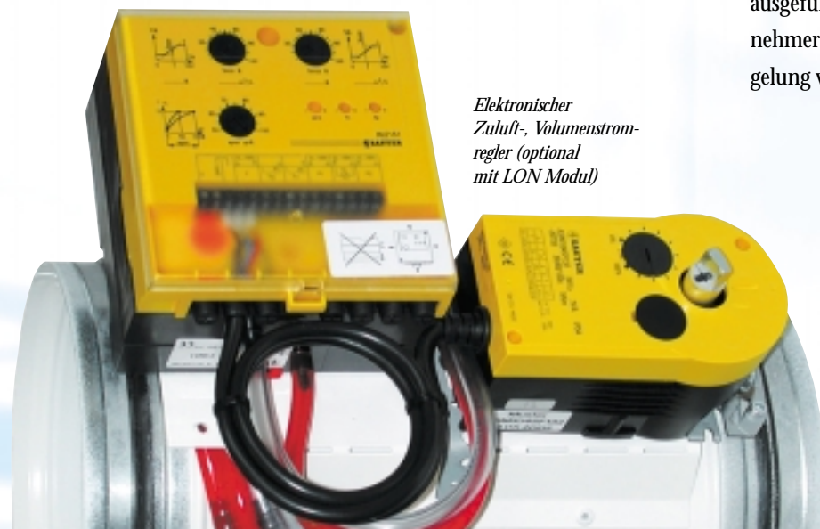
Elektronischer Zuluft-, Volumenstromregler (optional mit LON Modul)