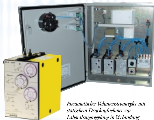
Pneumatischer Volumenstromregler mit statischem Druckaufnehmer zur Laborabzugsregelung in Verbindung mit pneumatischem Klappenantrieb sind Laufzeiten von 3 sec. für 90° Klappenwinkel Standard