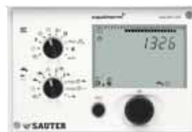
SAUTER equitherm® EQJW135