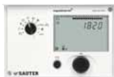
SAUTER equitherm® EQJW125